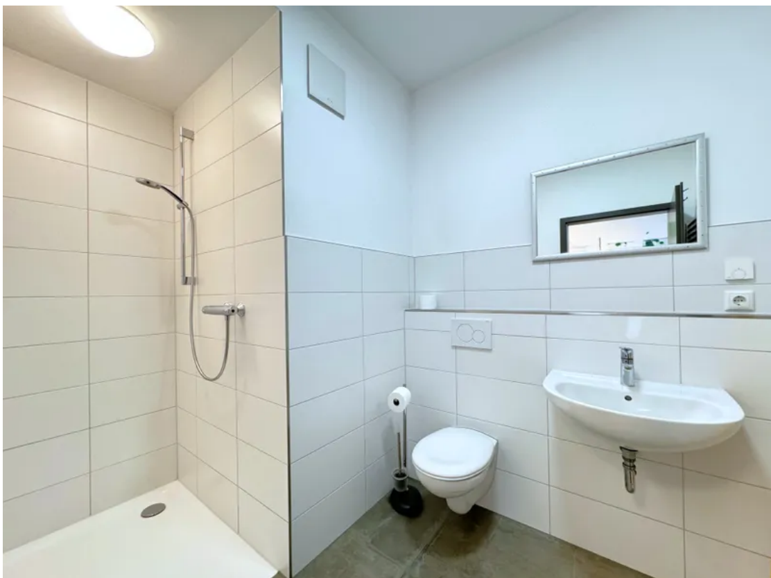
Bad / WC Mitarbeiter