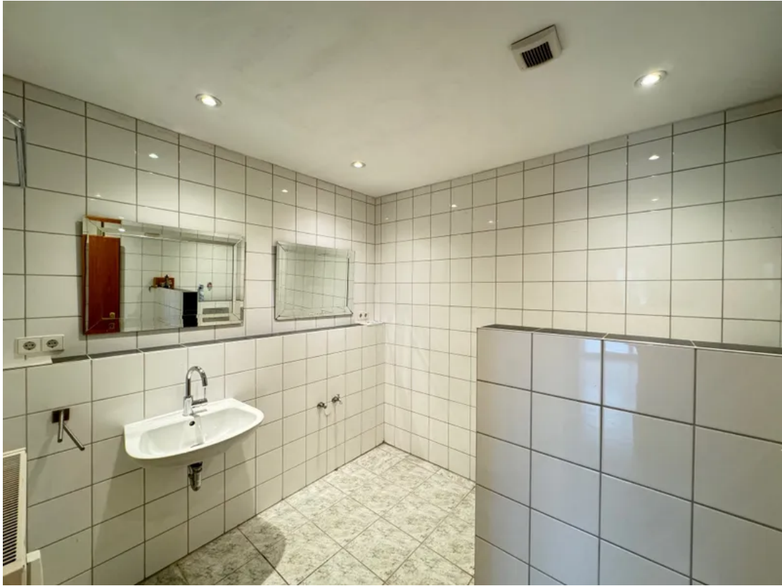
Wohnung OG Bad