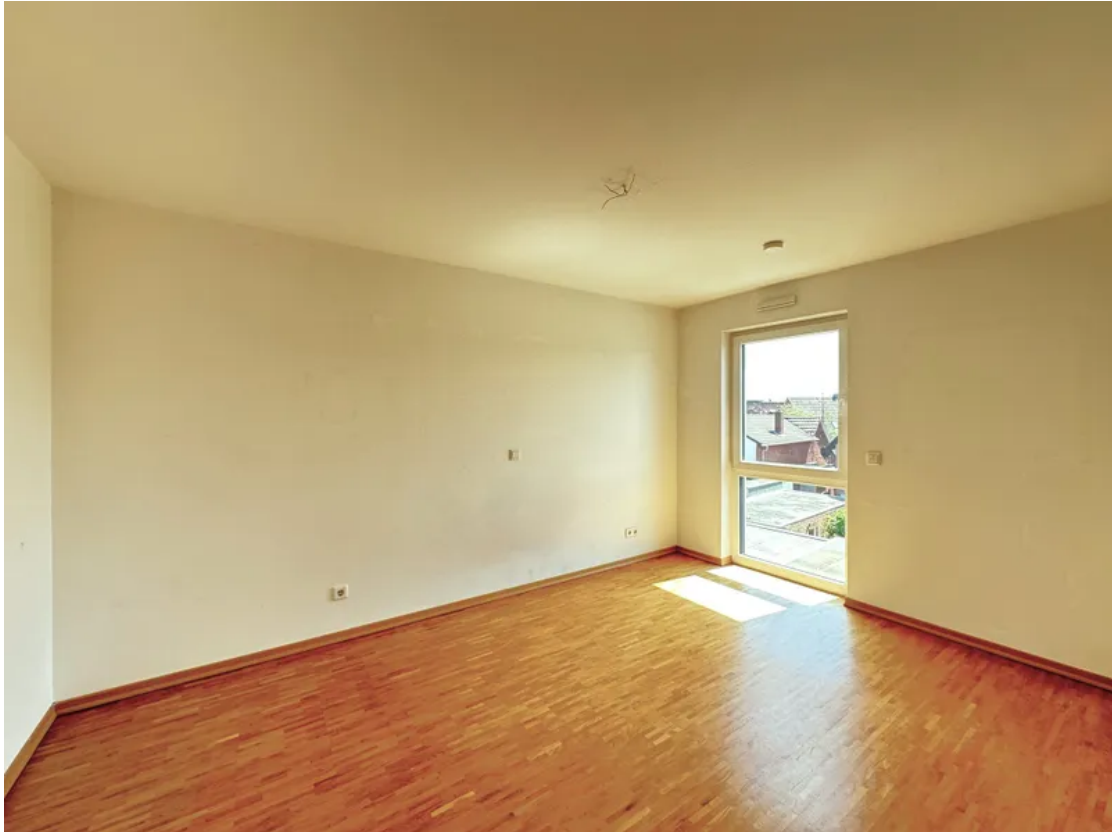
Schlafzimmer WG 11