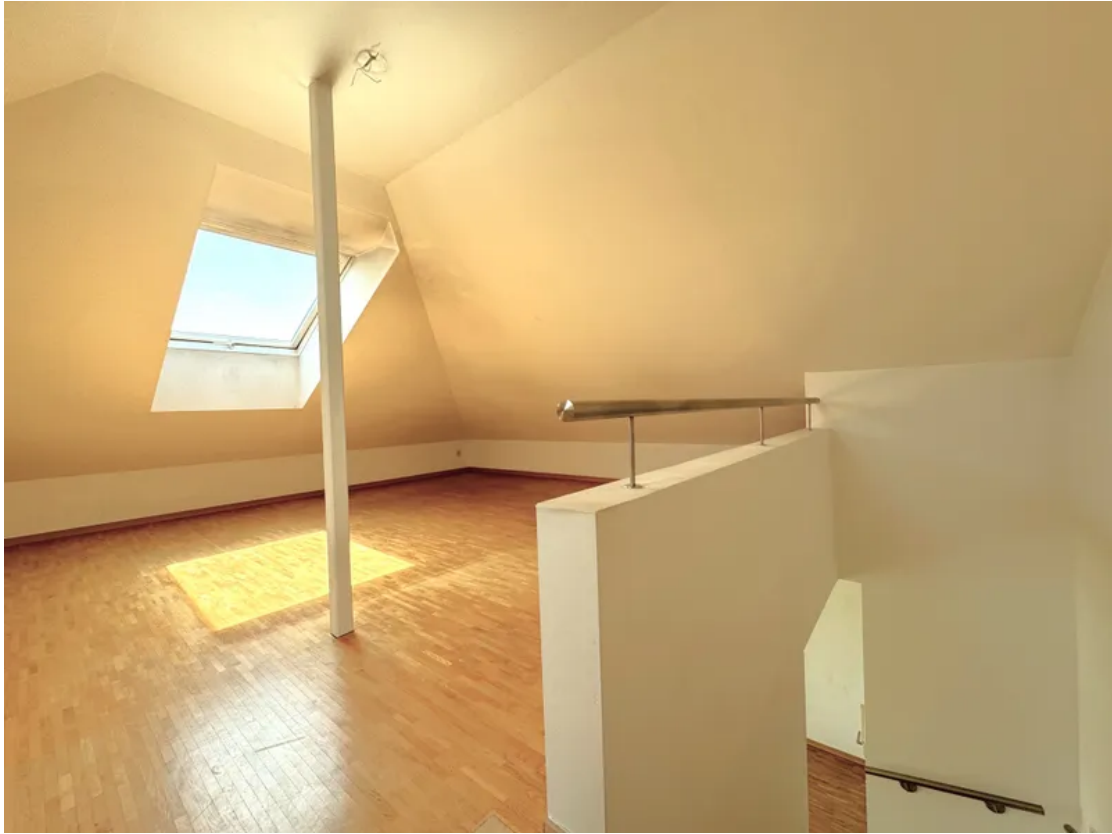
OG WG 11