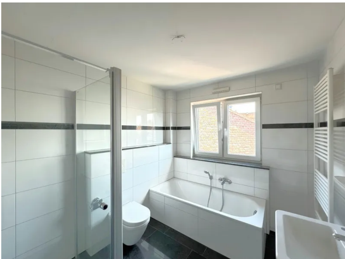
Bad WG 11