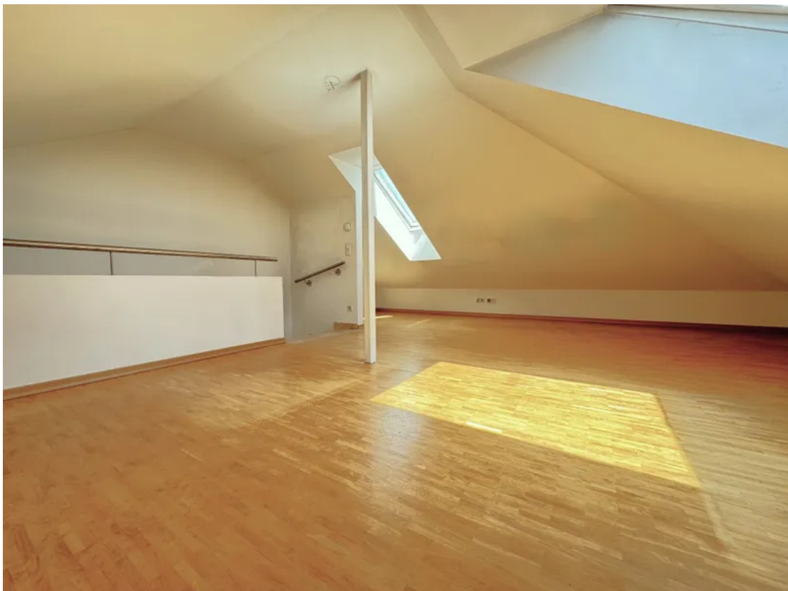
OG WG 11