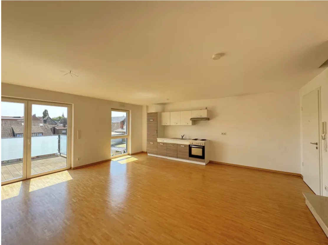
Wohnen WG 11