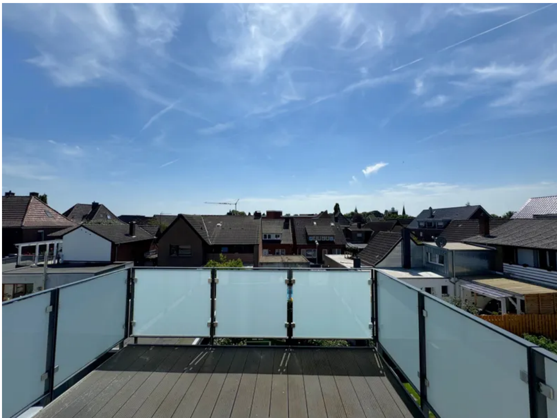
Balkon WG 11