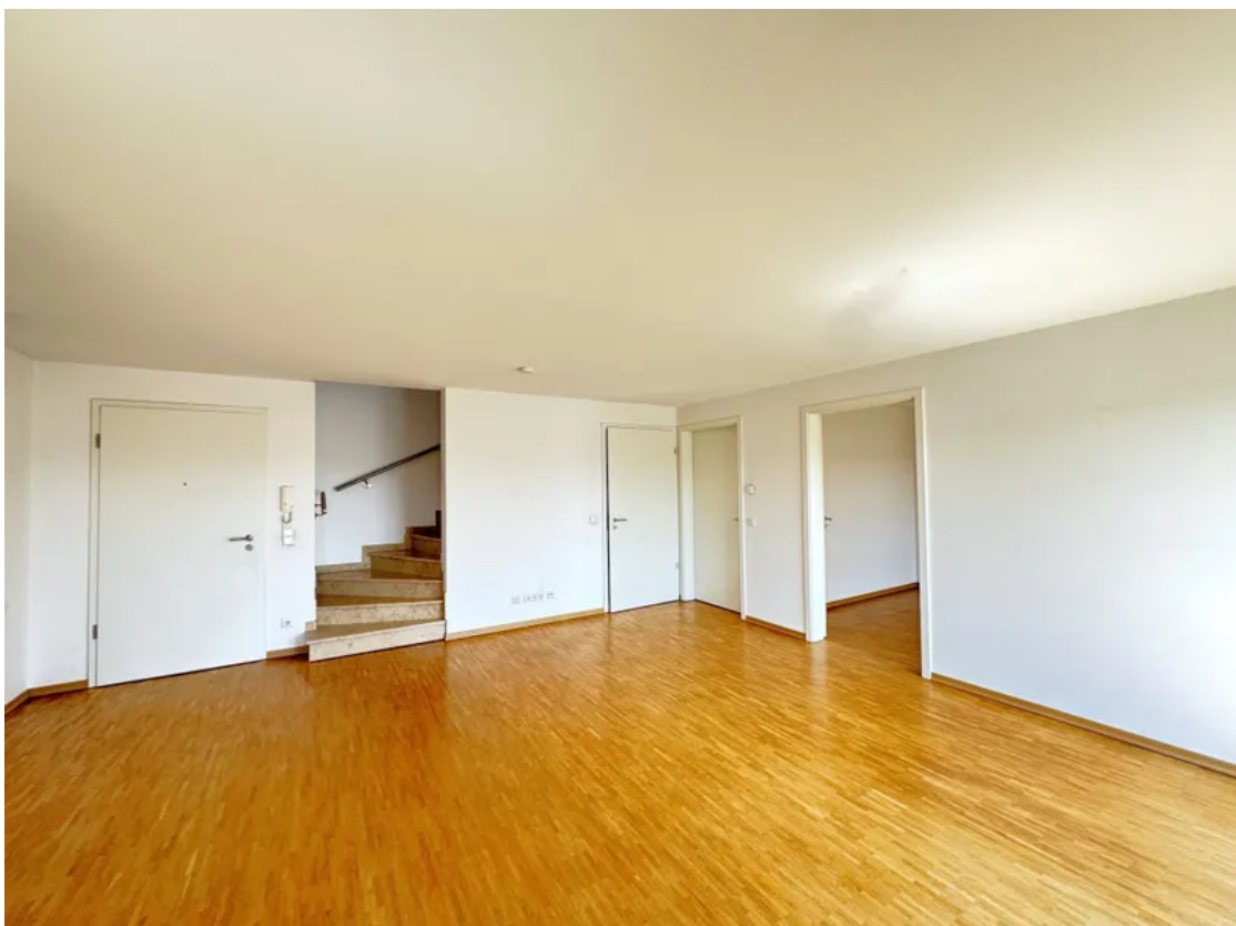
Wohnen WG 11